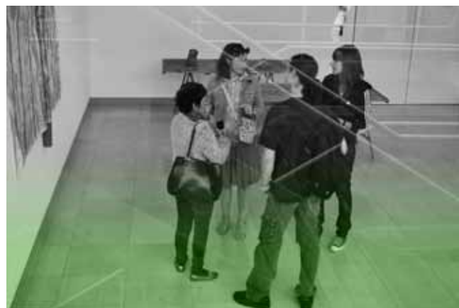
Carré d'art Nimes