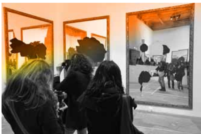
Biennale de Venise

Née en 1998, notre association des étudiants regroupe les étudiants actuels comme les anciens, dans le but de favoriser les liens et les activités communes. Chaque année, de nombreuses opérations sont organisées par l'association, qui permettent, en partie, de financer les sorties et un voyage pour les étudiants de BTS deuxième année.