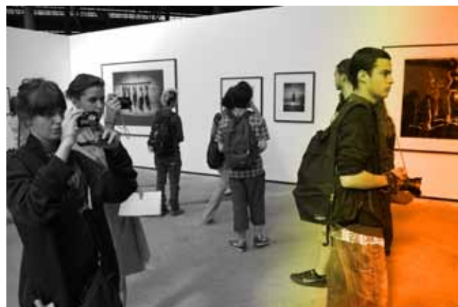
Rencontres Internationales de la Photographie Arles