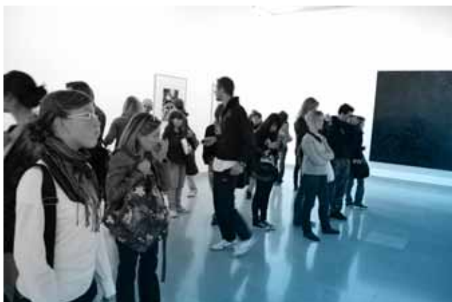
Carré d'art Nimes