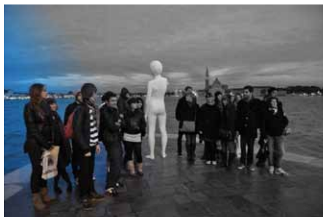
Biennale de Venise