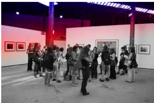
Rencontres Internationales de la Photographie Arles